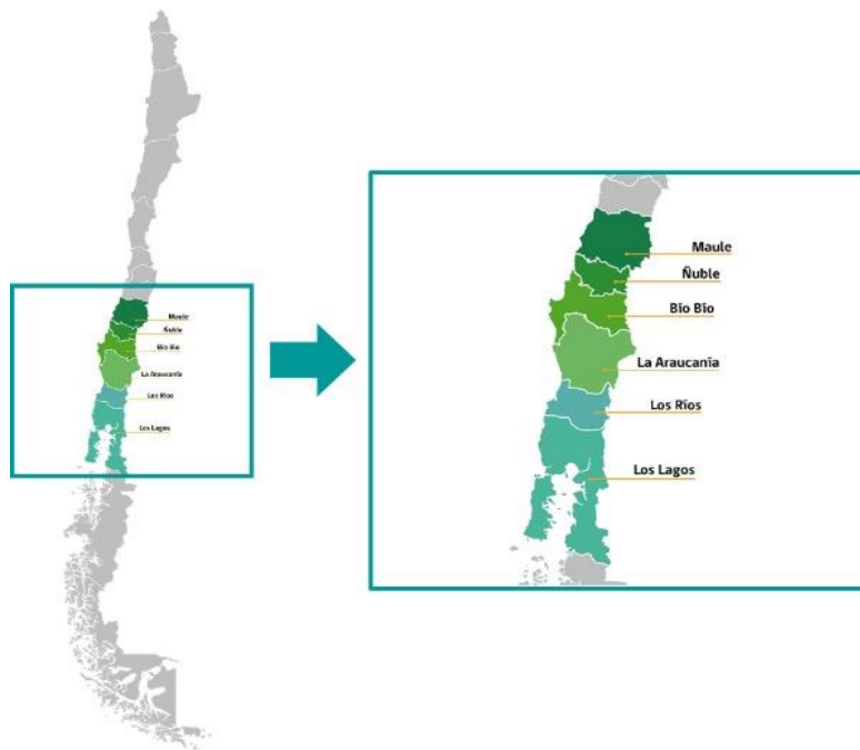
Figura 1. Mapa de Chile con las regiones beneficiarias del concurso público de la Estrategia Nacional de Cambio Climático y Recursos Vegetacionales de CONAF.

Se destaca que, la distribución de beneficios se realizará en estas regiones debido a que el país demostró a nivel internacional, ante el Fondo Verde del Clima, la reducción de emisiones en dicha área.