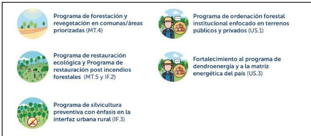
Figura 2. Medidas de acción de la Estrategia que se implementan en proyectos territoriales concursables.

Las actividades posibles de financiar en cada programa, junto a los costos asociados, se describen en detalle en las bases técnicas del concurso.